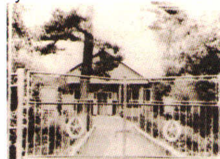
Старое здание Рава-Русской заставы

Не случайно его вскоре выдвинули на должность начальника заставы. Когда грянула война, главный удар на участке украинской границы немцы нанесли именно под Рава-Русской, где по старой Варшавской дороге,